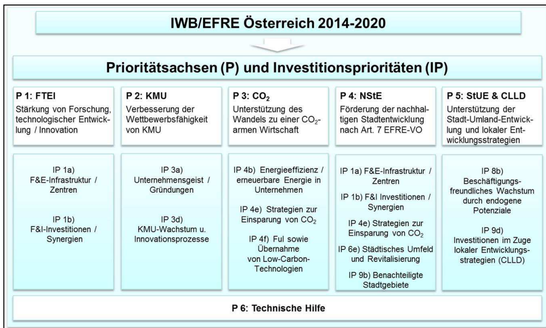
Abbildung „Struktur des österreichischen IWB/EFRE-Programms“: